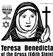
Teresa Benedicta of the Cross (Edith Stein)